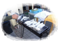
お外でホクホク焼き芋大会