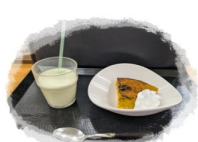
かぼちゃのプディング